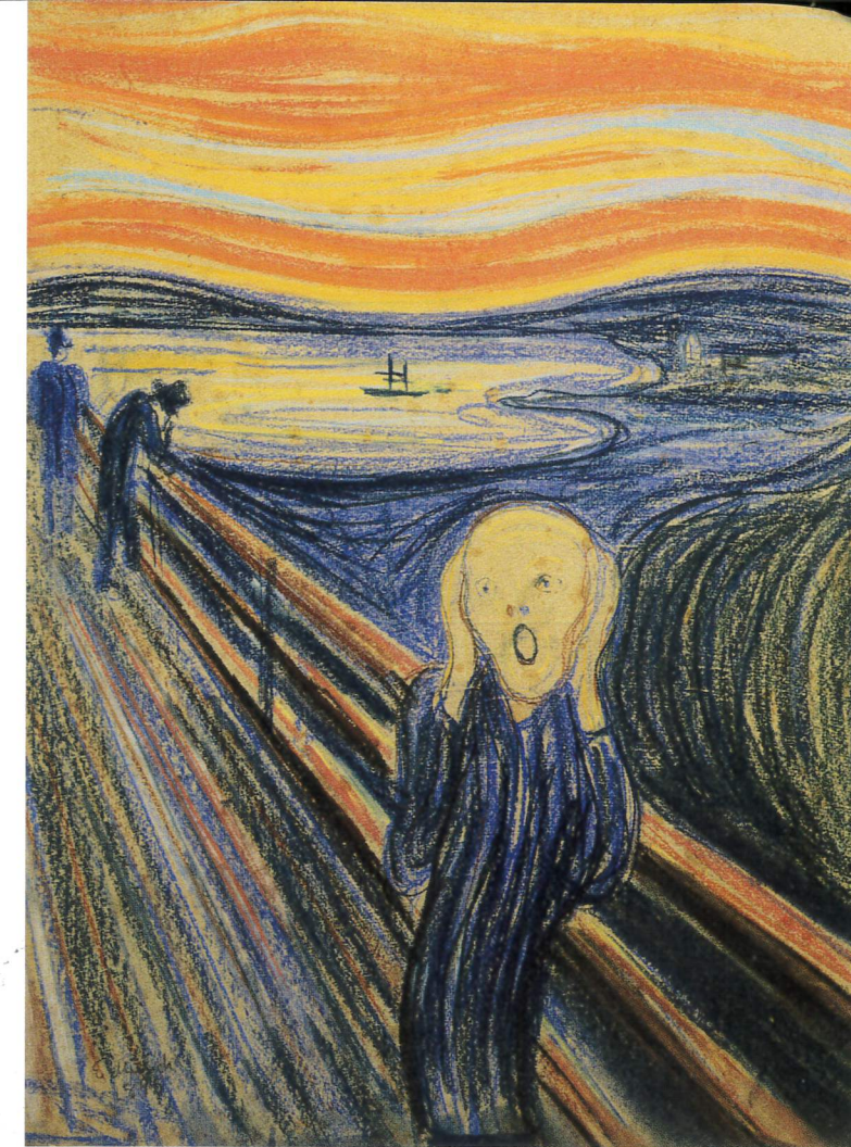
Edvard Munch: «Skrik», 1893

Det mest berømte bildet til Edvard Munch er «Skrik». Verken mennesker eller natur ser ut som på bildet. Derfor må det være noe annet Edvard Munch har villet male. Nå har han faktisk fortalt hva han ville med bildet: Han ønsket å vise hva han følte . Hvorfor tror du Munch kalt bildet «Skrik»?